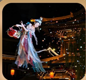
“เมืองโบราณลั่วอี้”

ชมถ้ำหลงเหมิน มรดกโลกที่เมืองลั่วหยาง • สุสานจิ้นซีฮ่องเต้ • ศาลเจ้ากวนอู วัดเส้าหลิน + ป่าเจดีย์ + ชมโชว์กังฟู • เมืองโบราณลั่วอี้ • อุทยานหุบไม้ไถ่ซาน เจดีย์ห่านป่าใหญ่ • ถนนวัฒนธรรมต้าถิง • ถนนคนเดินอิสลาม • จัตุรัสหอรบะซิง