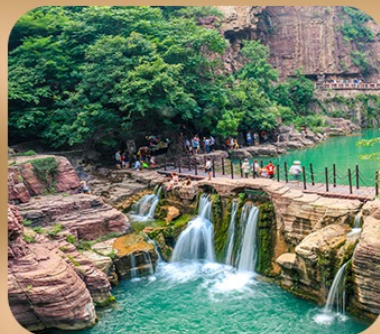
“อุทยานหุบไม้ไถ่ซาน”