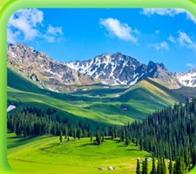
"กุ้งหน้านาราตี"