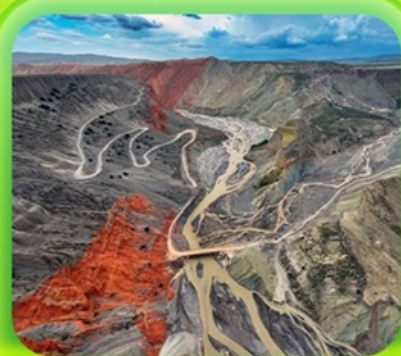
"แกรนด์แคนยอนคู่ชาวจื่อ"

ซินเจียงเหนือ ทะเลสาบไซลีมู่ "น้ำตาหยดสุดท้ายของแอตแลนติก" • กุ้งหน้านาราตี กุ้งดอกไม้เทียนซาน • ผ่านชมสะพานกั๋วจื่อโกว • ถนนหลิวซิงเจียง • ตลาดต้าปาจา