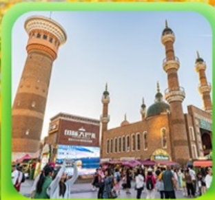
"ตลาดต้าปาจา"

ซินเจียงเหนือ ทะเลสาบไซลีมู่ "น้ำตาหยดสุดท้ายของแอตแลนติก" • กุ้งหน้านาราตี กุ้งดอกไม้เทียนซาน • ผ่านชมสะพานกั๋วจื่อโกว • ถนนหลิวซิงเจียง • ตลาดต้าปาจา