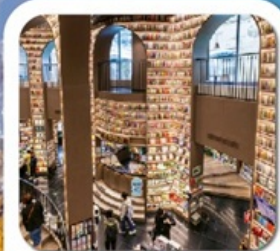
“ห้างสรรพสินค้าจงซูเก๋อ”