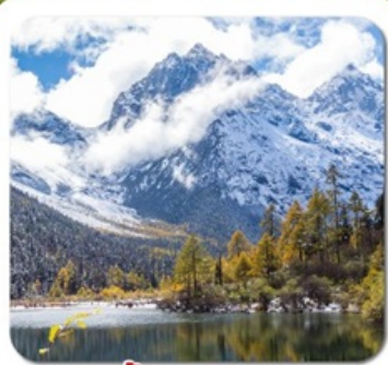
“ปี้เผิงโกว”

ชมความงาม 2 อุทยาน • สี่ดรุณี ของเฉียวโกว + ปี้เผิงโกว • พระใหญ่เล่อซาน สะพานหนานเฉียว น้ำตาสีฟ้า • ห้างสรรพสินค้า จงซูเก๋อ • แพนด้ายักษ์บนอนเซลฟ์ ชอยกว้างชอยแคบ • ถนนคนเดินชุนซีลู่ • แพนด้ายักษ์ปิ่นตึก • ถนนคนเดินจินหลี่