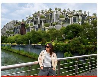
Tian an 1000trees