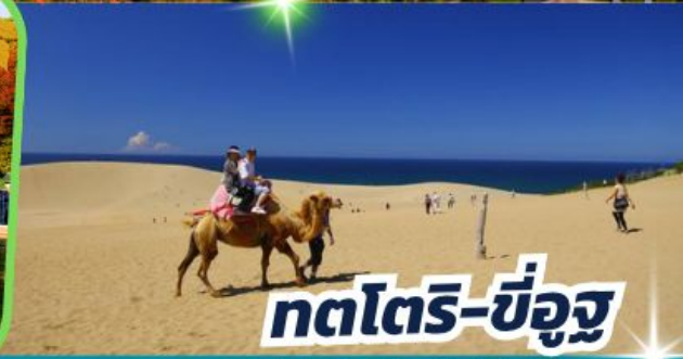
ทตโตริ-ซึอู