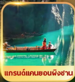
แกรนด์แคนยอนผิงซาน