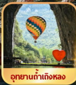
อุทยานต้าเถิงหลง