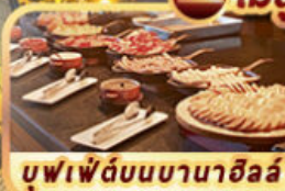
บุฟเฟ่ต์บนบานาฮิลล์