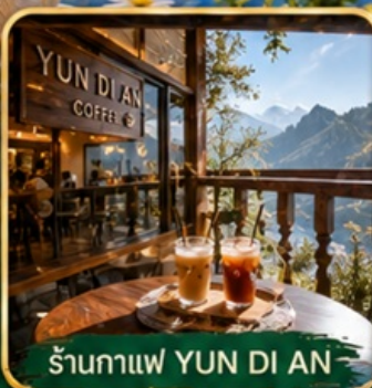
ร้านกาแฟ YUN DI AN