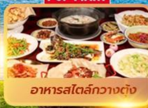
อาหารสตรีทกวางตุ้ง