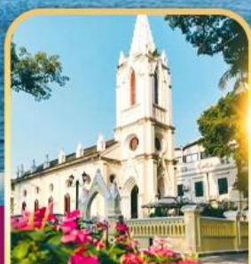
เกาซาเมียน