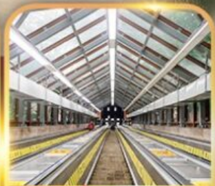
บันไดเลื่อนหวงกวน