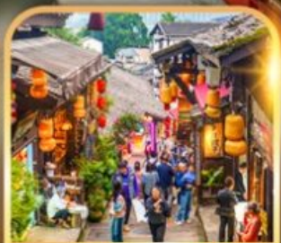
หมู่บ้านโบราณฉือชี่ฮั่ว