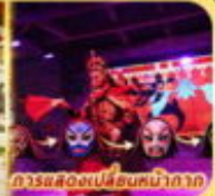
การแสดงเปลี่ยนหน้ากาก