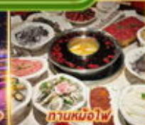
ทานหม้อไฟ