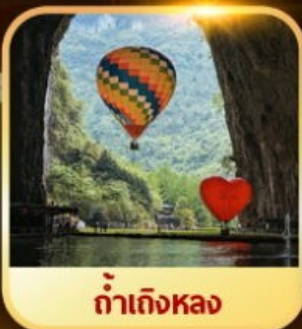
ท่าเก็งหลง