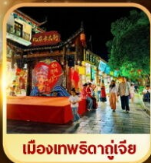
เมืองเทพริดาตู้เจีย