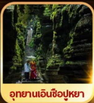
อุทยานเอ็นซีอูหย่า