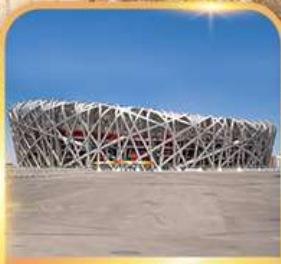
สนามกีฬาρινก