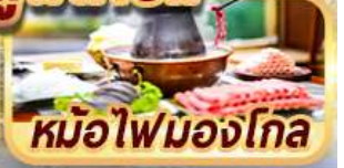
หม้อไฟมองโกล