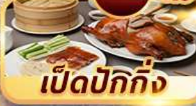
เป็ดปักกิ่ง