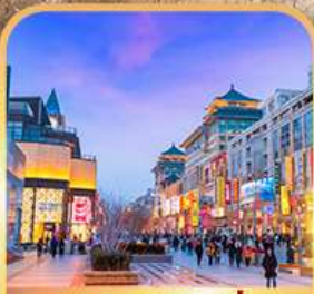
ถนนหวงฟูจิ่ง