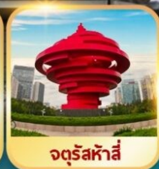
จตุรัสหาลี่