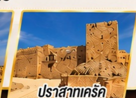
ปราสาทครัค