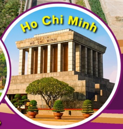
Ho Chi Minh