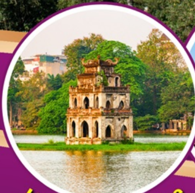
Hoan Kiem Lake