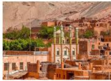
เมืองเกาคัซการ์