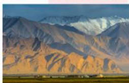
พระอาทิตย์ขึ้นที่ภูเขาเมฆหัด อะทา