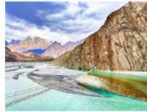
สะพานแขวนสูลไซนี