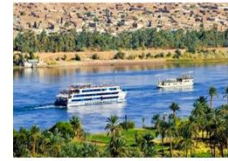
พักผ่อนตามอัธยาศัย บนเรือสำราญ

** พักที่ Royal Beau Rivage Nile cruise 5* หรือเทียบเท่า **