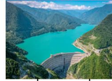
เช็อนเอนกูรี