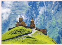
Gergeti sameba church

** พักที่ Intourist Kazbegi Hotel หรือเทียบเท่า **