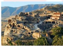
เมืองอพลิสซิเค