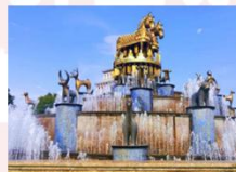
เมืองคูไทซี

** พักที่ Kutaisi Inn Hotel หรือเทียบเท่า **