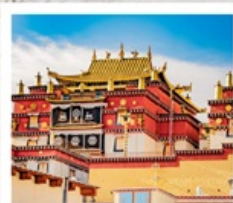
วัดชงจ้านหลิง

คุนหมิง • ยาดิง • เต๋อซิง • แชงกรีล่า 8 DAYS 7 NIGHTS