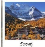
วัดชงกู่