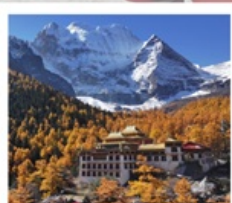
วัดชงกู่