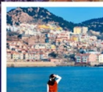
หาดซาจื่อฮั่ว