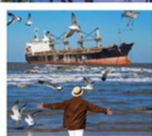
เรือลิวส์