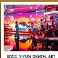
EDCC YIYUN DIGITAL ART