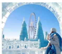
ICE &amp; SNOW FEST.