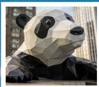
ห้าง IFS แพนด้าป็นตึก