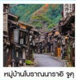
หมู่บ้านโบราณนารายิ จุกุ