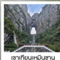
เขาคิยันเหมินชาน