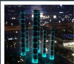
ห้างสรรพสินค้า SKP