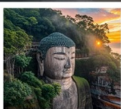
หลวงพ่อดีเล่อซาน