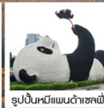
รูปปั้นหมีแพนด้าชงชิ่ง