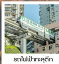
รถไฟฟ้าทะเลคุตัก