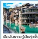
เมืองโบราณกุ๋เป่ย์ซู่ยเจิน