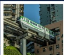
นั่งรถไฟทะลุติ๊ก