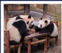
สวนสัตว์ฉงชิ่ง

สวนสัตว์ฉงชิ่ง • เมืองโบราณซือปาเก้ • หมู่บ้านโบราณฉือซีชี่ว • มหาศาลาประชาชน นั่งรถไฟทะลุติ๊ก • ถนนโบราณหลงเหมินเฮ่า • ถนนเซี่ยเฮ่าหลี่ • วัดหลิวอัน • Raffles City • หงหยาดัง ถนนคนเดินเจี่ยฟ่างเป็ย POP MART • ล่องเรือแม่น้ำแยงซีเกียง • พิพิธภัณฑ์ศิลปะฉงชิ่ง • ตึกซูชิง 22 ชั้น • THE RING MALL