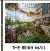
THE RING MALL