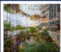
THE RING MALL