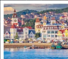
ท่าเรือประมงเหยียนโกะ