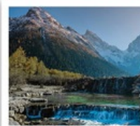
อุทยานป่าผิงโกว