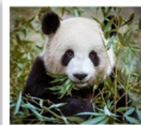
ศูนย์หมีแพนด้าตูเจียงเยียน