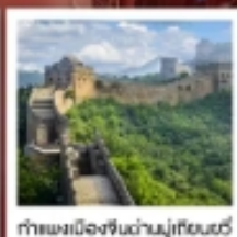
กำแพงเมืองจีนด่านมู่เถียนยวี่