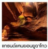
แกรนด์แคนยอนยูงาโกว