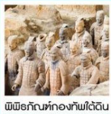
พิพิธภัณฑสถานกองทัพใต้ดิน