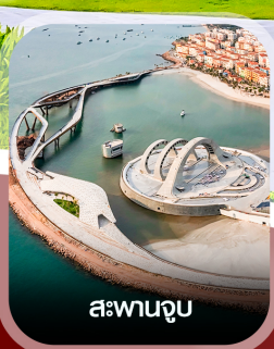
สะพานจูป

✈️ คอนเฟิร์มออกเดินทาง ทุกพีเรียด 2 ท่านขึ้นไป