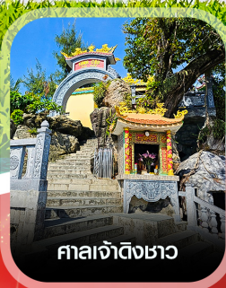
ศาลเจ้าดิ้งซา