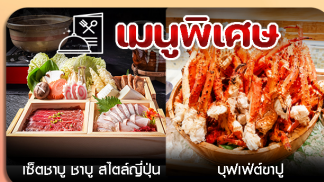
เรีตซาบู ซาบู สลัดสัปปุ๊น