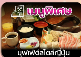
บุฟเฟ่ต์สไตล์ญี่ปุ่น

ซัปโปโร-ชมทุ่งดอกลาเวนเดอร์-โทมิตะฟาร์ม-ชิชิโนะโอะกะ-น้ำตกชิราอิเกะ-บ่อน้ำสีฟ้า-อีสระะซ็อบบั้งเต็มวัน-ฟักออนเซน