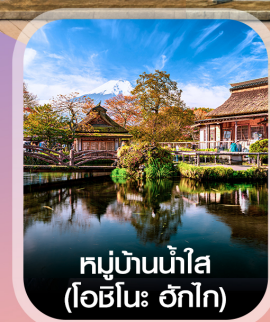
หมู่บ้านน้ำใส (โอชิโนะ วัตโก)

เช็กอินเกาะเอโนะชิมะ ถ่ายรูปเม้าท์ฟูจิ จุดยอดฮิตตามซีรีส์ Can this love คามาคุระ เดินเล่นหมู่บ้านน้ำใส ช้อปปังโกเกมบะเอากิเล็ด อีสะะ ช้อปปิ้งเต็มวัน