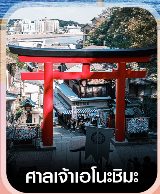
ศาลเจ้าเอโนะชิมะ