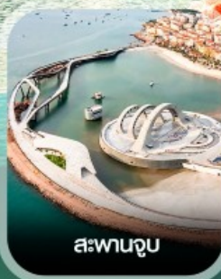
สะพานจูป