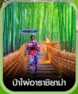
ป่าไผ่อาราชิมาม่า