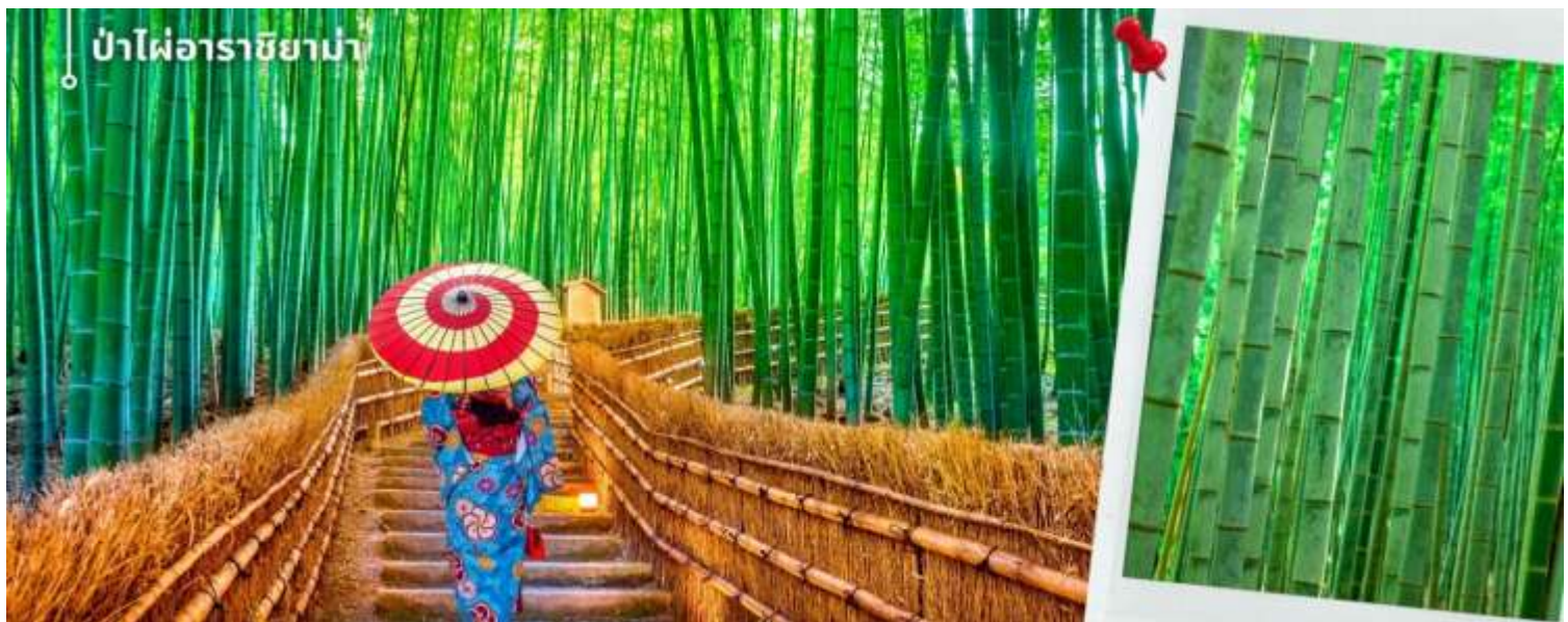
ป่าไผ่อาราชิยาม่า

จากนั้นนำท่านเดินทางสู่ ป่าไผ่อาราชิยาม่า ซึ่งอยู่ไม่ไกลจากสะพานโทเก็ตสึเคียว ป่าไผ่แห่งนี้เป็นป่าไผ่ที่ใหญ่ที่สุดในญี่ปุ่น ทั้งสวยและโด่งดังที่สุดในประเทศญี่ปุ่น โดยตลอดสองข้างทางนั้นจะมีต้นไผ่สีเขียวขจีสูงเสียดฟ้า ยาวกว่า 10 เมตร เรียงรายอยู่เป็นระยะทางประมาณ 500 เมตร ที่จะทำให้เราได้สัมผัสกับเสียงต้นไผ่ที่กระทบกัน ให้ความร่มรื่นสงบ เย็นสบาย และแสงที่ลอดผ่านต้นไผ่ให้ความรู้สึกอบอุ่น เป็นเสน่ห์อีกอย่างหนึ่ง ให้ท่านได้เดินชมและเก็บภาพความประทับใจเป็นที่ระลึก