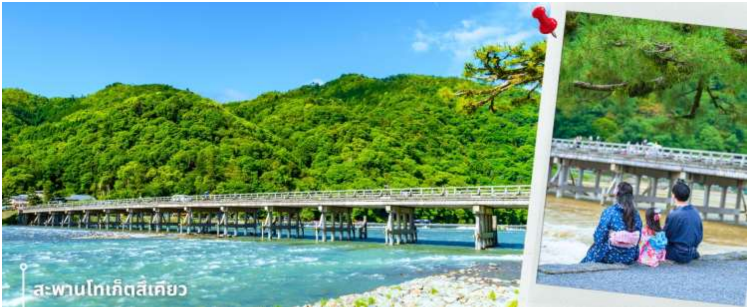
สะพานโทเก็ตสึเคียว

จากนั้นนำท่านเดินทางสู่ ป่าไผ่อาราชิยาม่า ซึ่งอยู่ไม่ไกลจากสะพานโทเก็ตสึเคียว ป่าไผ่แห่งนี้เป็นป่าไผ่ที่ใหญ่ที่สุดในญี่ปุ่น ทั้งสวยและโด่งดังที่สุดในประเทศญี่ปุ่น โดยตลอดสองข้างทางนั้นจะมีต้นไผ่สีเขียวขจีสูงเสียดฟ้า ยาวกว่า 10 เมตร เรียงรายอยู่เป็นระยะทางประมาณ 500 เมตร ที่จะทำให้เราได้สัมผัสกับเสียงต้นไผ่ที่กระทบกัน ให้ความร่มรื่นสงบ เย็นสบาย และแสงที่ลอดผ่านต้นไผ่ให้ความรู้สึกอบอุ่น เป็นเสน่ห์อีกอย่างหนึ่ง ให้ท่านได้เดินชมและเก็บภาพความประทับใจเป็นที่ระลึก