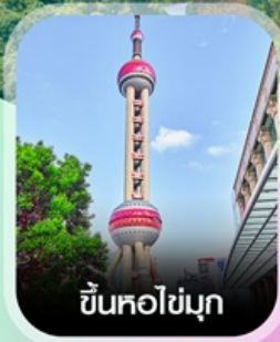
ขึ้นหอไข่มุก