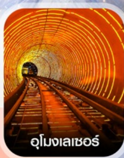
อุโมงเลเซอร์

✈️ คอนเฟิร์มออกเดินทาง ✈️ ทุกพีเรียด 2 ท่านขึ้นไป