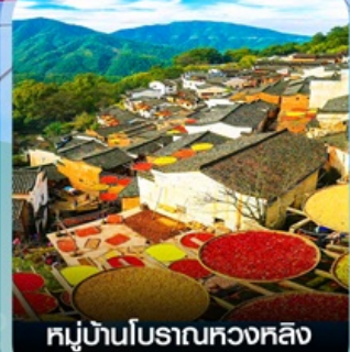
หมู่บ้านโบราณหวงหลิง (หมู่บ้านตากพรึก)