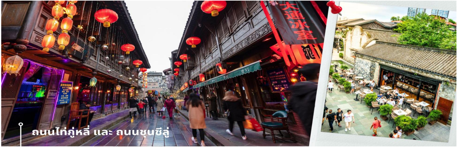
ถนนไท่กุ่หลี่ และ ถนนชุนซีลู่

จากนั้นให้ท่านให้อิสระกับการเลือกซื้อสินค้าของฝากที่ ถนนไท่กุ่หลี่ และ ถนนชุนซีลู่ ในย่านนี้เป็นถนนโบราณ ในอดีตเคยโรงงานผลิตผ้าไหมใหญ่ที่สุดในจีน ปัจจุบันได้เปลี่ยนเป็นถนนช้อปปิ้งแหล่งสวรรค์ของนักท่องเที่ยว เป็นถนนคนเดินมีห้างสรรพสินค้าชื่อดัง มีร้านค้ามากกว่า 700 ร้านค้าที่เต็มไปด้วยสินค้าต่าง ๆ ทั้งร้านค้าแฟชั่น ร้านอาหาร และโรงแรมนานาชาติมากมายซึ่งเป็นที่ที่เที่ยวงเชิงดูที่มีการเชื่อมต่อทางวัฒนธรรมท้องถิ่นที่เป็นแหล่งช้อปปิ้งและเป็นแหล่งร้านอาหารที่อร่อยต่าง ๆ มากมาย ซึ่งเป็นสถานที่ที่เที่ยวงเชิงดูที่ทำให้เพลิดเพลินกับสินค้าแบรนด์เนมและแบรนด์จีน เพื่อให้นักท่องเที่ยวได้เลือกซื้อตามอิสระ