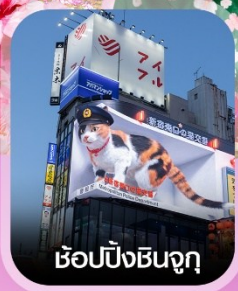
ซ้อปิ้งชินจูกุ

คอนเฟิร์มออกเดินทาง ทุกพีเรียด 2 ท่านขึ้นไป