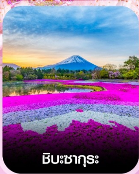
ชิบะซากุระ