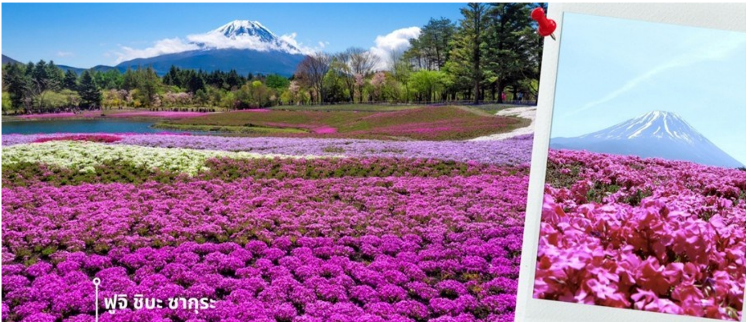
ฟูจิ ชิบะ ซากุระ

หลังรับประทานอาหารเช้า นำท่านเดินทางสู่ งานเทศกาลชมดอกชิบะซากุระ ที่สามารถมองเห็นทุ่งดอกไม้สีชมพูสดไส พร้อมกับฉากหลังภูเขาไฟฟูจิ เรียกได้ว่าเป็นแหล่งท่องเที่ยวที่ผู้คนแห่กันมาชมความงดงาม ดอกชิบะซากุระ หรือดอก phlox มีชื่อเรียกหลายชื่อเช่น creeping phlox, moss phlox, moss pink หรือ mountain phlox และมีหลายเฉดสี ตั้งแต่สีม่วง สีฟ้า สีขาว และสีชมพู ถึงแม้ว่าชื่อของดอกไม้นี้จะเรียกว่า ชิบะซากุระ แต่ดอกไม้ชนิดนี้เป็นคนละสายพันธุ์กับดอกซากุระปกติ โดยดอกชิบะซากุระ จะมีชื่อเรียกอีกชื่อว่า พืชมอส (Pink Moss) มีถิ่นกำเนิดมาจากอเมริกาเหนือ เป็นพืชตระกูลมอส ที่เติบโตขึ้นตามพื้นดิน ดอกมีขนาดเล็ก และกลีบดอกมีลักษณะคล้ายกับดอกซากุระ หากดอกไม้บานเต็มที่ พื้นดินจะดูเหมือนปูพรมด้วยสีอันสดใสหลากหลายเฉดสี ให้ความสวยงาม เทศกาลดอกไม้ไม่มีขึ้นทุกปีในช่วงประมาณกลางเดือนเมษายนเป็นต้นไป ทั้งนี้ขึ้นอยู่กับสภาพอากาศในแต่ละปีด้วย ให้ท่านได้ชมทุ่งดอกไม้สีชมพูแผ่กระจายไปสู่สายตาที่ฉากหลังแสนสวย