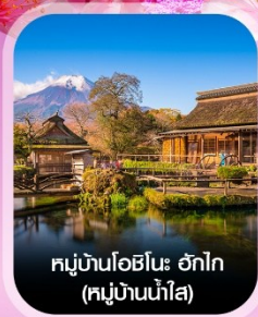
หมู่บ้านโอชิโนะ ฮักไก (หมู่บ้านน้ำใส)

เช็กอินเทศกาล ชิบะซากุระ ทุ่งฟิงค์มอส ย้อนอดีตที่หมู่บ้านโบราณอิยาชิโนะซาโตะ ซ้อปิ้งโกเทมบะเอาท์เล็ต ฟักออนเซ็น กินบุฟเฟต์ซาบู อิสระซ้อปิ้งเต็มวัน