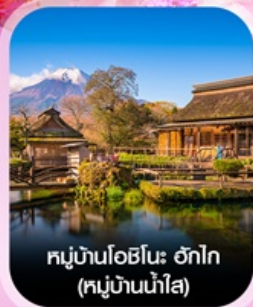
หมู่บ้านโฮชิโนะ ฮากาอิ (หมู่บ้านน้ำใส)

✈ คอนเฟิร์ม ออกเดินทาง ทุกพีเรียด 2 ท่านขึ้นไป