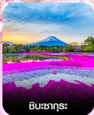
ชิบะซากุระ