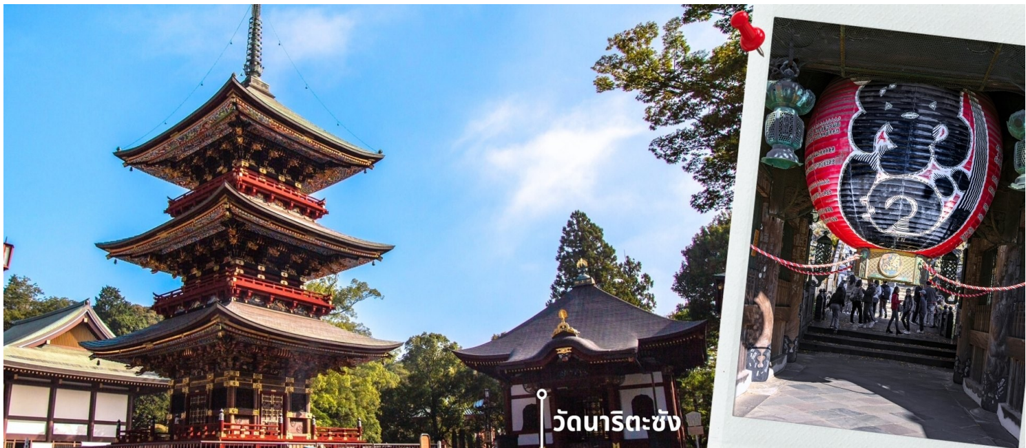
วัดนาริตะซัง

10.45 น. เดินทางถึงสนามบินนาริตะ ประเทศญี่ปุ่น หลังจากผ่านพิธีตรวจคนเข้าเมืองและศุลกากรแล้ว นำท่านขึ้นรถโค้ชปรับ เที่ยง อากาศ เดินทางออกจากสนามบิน เพื่อ นำท่านเดินทางรับประทานอาหารเที่ยง รับประทานอาหารเที่ยง ณ ภัตตาคาร (2) เมนูพิเศษ เซ็ตซาบู ซาบู สไตล์ญี่ปุ่น หลังรับประทานอาหารเที่ยง นำท่านไหว้พระขอพรที่ วัดนาริตะซัง ซินโซจิ Narita San Shinsho-ji เป็นวัด ศาสนาพุทธ ตั้งอยู่ที่ จังหวัดชิบะ (ใช้เวลาเดินทางประมาณ 30 นาที) เป็นวัดที่เก่าแก่ที่สุดแห่งหนึ่งในญี่ปุ่น มี โครงสร้าง รูปปั้น และสิ่งศักดิ์สิทธิ์ที่มีประวัติยาวนานหลายศตวรรษ สร้างขึ้น เพื่อบูชาอะคะระซึ่งเป็นเทพแห่งไฟ พิธีกรรมที่น่าสนใจที่สุดอย่างหนึ่งคือ พิธีสวดขอพรโกมะ ให้ท่านได้สักการะ องค์ฟูโดเมียวโอ หรือที่เรียกกันว่า “นาริตะฟูโด” ซึ่งประดิษฐานอยู่ในวัด เป็นองค์พระประธานหลักและเป็นศูนย์กลางที่พึ่งทางจิตใจของผู้คนที่ศรัทธา