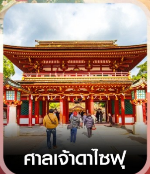
ศาลเจ้าดาไซฟู