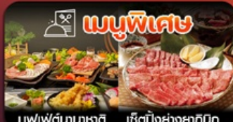
บุฟเฟ่ต์นาซาชิ เซ็ตบั้งย่างยากินุ

ฟุกุโอกะ-วัดนินโซอิน-หมู่บ้านยูฟูอิน-แบบบุ-บ่อนรกจิกุ-แช่ออนเซ็น-ช้อปิ้งเทนจิน-พักใกล้แหล่งช้อปิ้ง2คืน