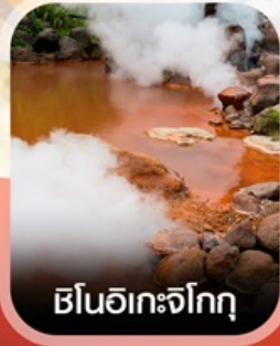
เซ็นอิเกะจิกุ

✈️ คอนเฟิร์ม ออกเดินทาง ✈️ ทุกพีเรียด 2 ท่านขึ้นไป