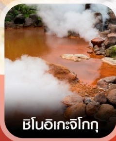
ฮิโนอิเคะจิกุ

✈️ คอนเฟิร์มออกเดินทาง ✈️ ทุกพีเรียด 2 ท่านขึ้นไป