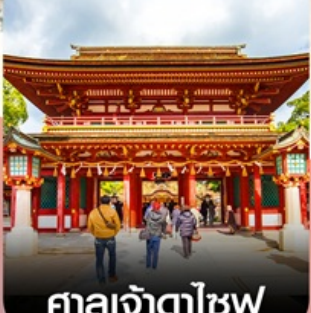
ศาลเจ้าตาไซฟุ