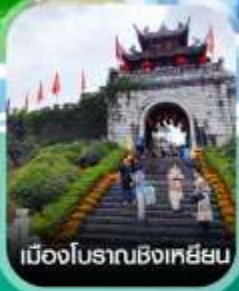
เมืองโบราณชิงเหยียน

คอนเฟิร์มออกเดินทาง ทุกพีเรียด 2 ท่านขึ้นไป