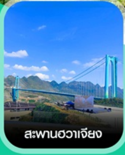
สะพานฮวาเจียง