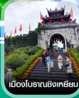
เมืองโบราณซิงเหยียน

✈️ คอนเฟิร์มออกเดินทาง ทุกพีเรียด 2 ท่านขึ้นไป