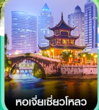
หอเจียเซี่ยวโหลว