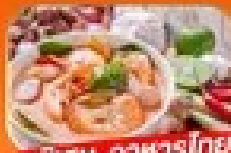
พิเศษ อาหารไทย