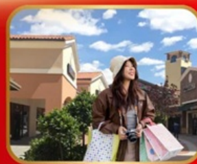
อิสระช้อปปิ้ง BEIJING OUTLET