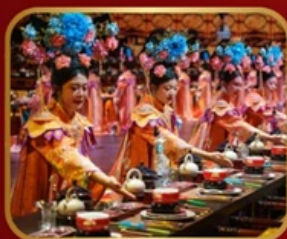
กัศตาคารวังหลวง YU XIAN DU