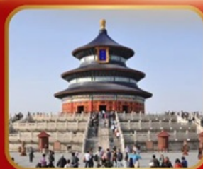
ชมความงดงาม หอฟ้าเทียนถาน