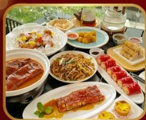
อาหารระดับ มิชลิน TAO TAO JU