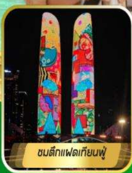
ชมตึกแพนด้ายักษ์