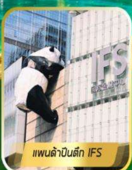
แพนด้าปีนตึก IFS