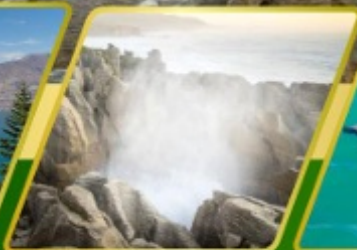
ไฮโซ, แพนเค้ก्रीด